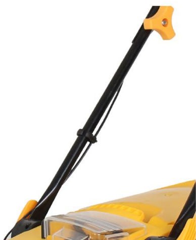
3. Tilpas kabel