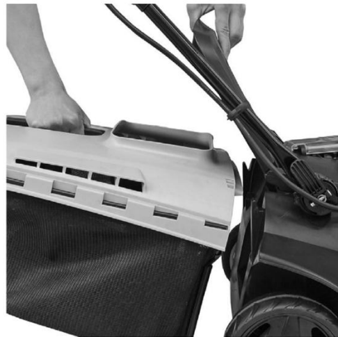
4. Attach the collector box