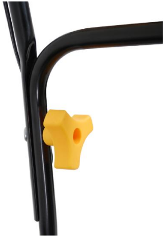
1. Attach and lock the two handlebars