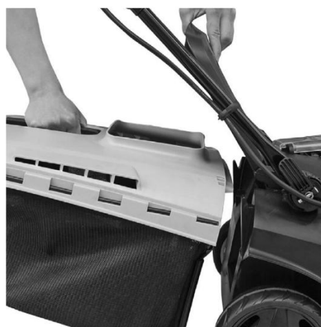
4. Monter opsamler kasse