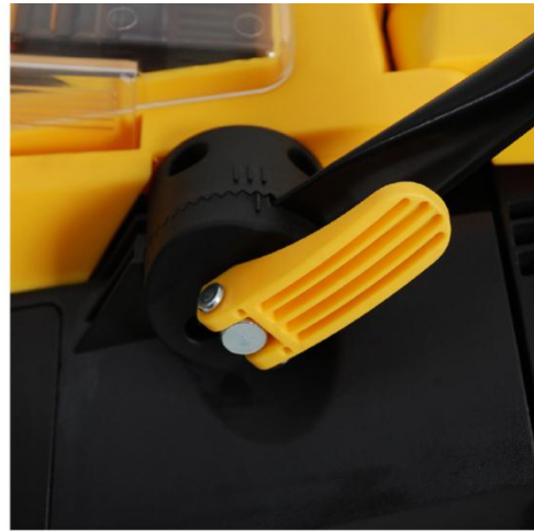
2. Attach and lock the handlebar