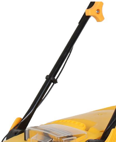
3. Adjust cable