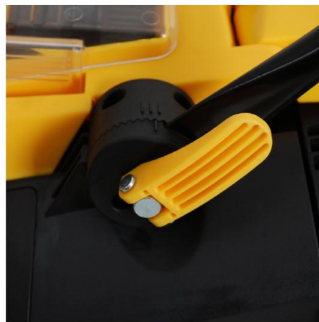
2. Monter understyr og fastlås